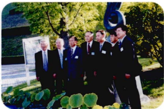
▲ 일본시가라끼정 방문 우호증진 경주 (2002. 7. 27)