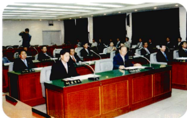
▲ 제55회 임시회의시 개정조례안에 대하여 설명을 듣고 있는 모습 (2002. 7. 16)