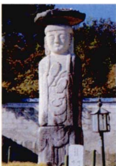
① 어석리미륵불상 (지방유형문화재 제107호)