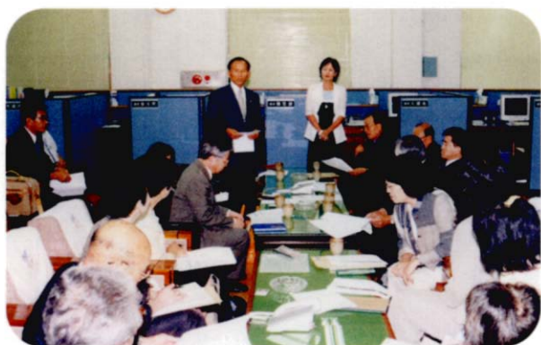
▲ 일본자치체의회 정책학회소속 지방의원 접견 (2002. 7. 23)