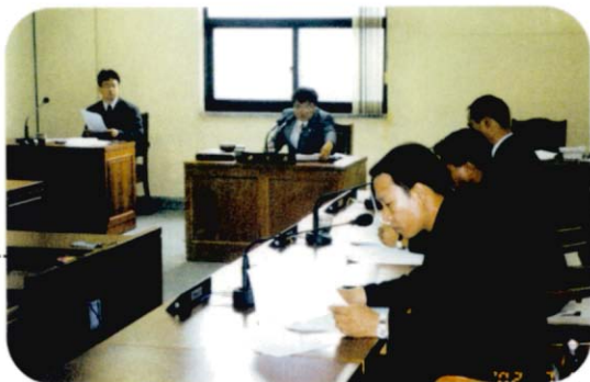
▲ 산업건설위원회 소속의원 활동모습 (2002. 8. 14)