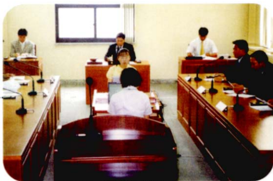
▲ 의회운영위원회 소속의원 활동모습 (2002. 7. 14)