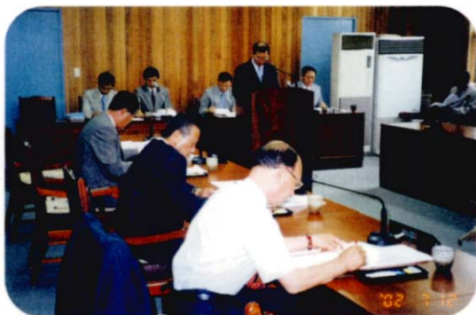
▲ 건설도시국장으로부터 2002주요업무에 대하여 보고를 받고 부실공사 근절 당부 (2002. 7. 12)