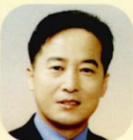
자치행정위원장 김학인 (金學仁)