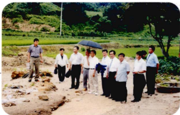
▲ 수해피해지역 현지확인 (2002. 8. 12)