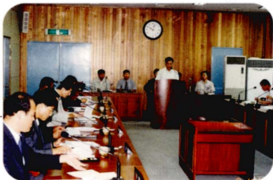
▲ 호우피해상황을 보고 받고 피해복구에 만전을 기해줄 것을 당부 (2002. 8. 14)