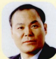
의원 이광희 (李光熙)