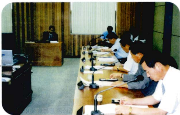
▲ 자치행정위원회 소속의원 활동모습