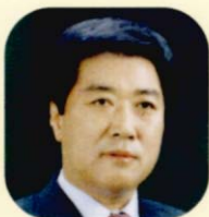
의원 이현호 (李鉉鎬)