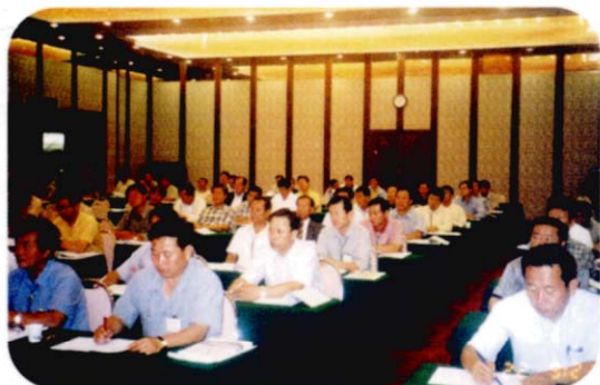
▲ 의원활동관련 전문지식 습득을 위한 의원 연수 (2002. 8. 22)