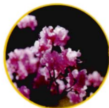
시화 : 진달래