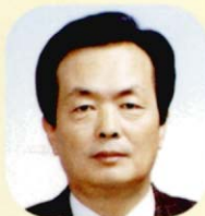
의원 정운한 (鄭雲漢)