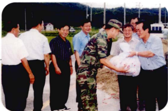
▲ 수해피해 복구작업 현장 방문 군장병 격려 (2002. 8. 10)