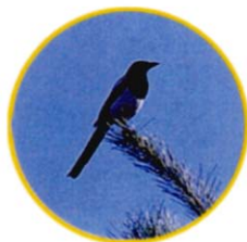
시조 : 까치