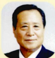
부의장 서동예 (徐東藝)