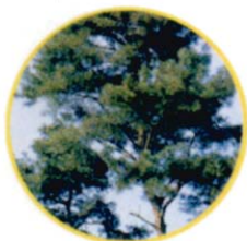
시목 : 소나무