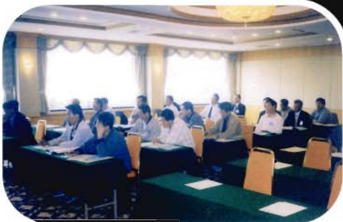
▲ 컴퓨터 활용/홈페이지 활성화